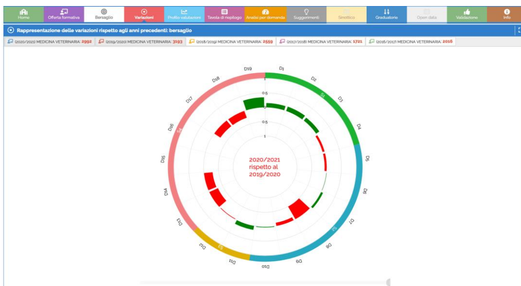
Grafico 1 – Rappresentazione grafica delle variazioni dei voti medi delle diverse domande al questionario sottoposto agli studenti tra il 2020/2021 e il 2019/2020 (in rosso le variazioni in negativo in verde quelle in positivo - Fonte www.sisvaldidat.it ).

maggior parte degli studenti (D1, voto medio 7.75), così come il carico di studio dell'insegnamento è ritenuto adeguato allo studio della materia nella maggior parte dei casi (D2, voto medio 7.66). Ottimale il giudizio degli studenti sul gradimento nei confronti degli insegnamenti seguiti e del "comportamento" didattico dei docenti. In particolare, i quesiti relativi al materiale didattico disponibile (D3, voto medio 8.00), alle definizioni delle modalità d'esame (D4, voto medio 8.40), al rispetto degli orari delle attività didattiche, alla chiarezza di esposizione del Docente (D5, voto medio 8.05), alla coerenza dello svolgimento dell'insegnamento con quanto dichiarato sul sito web (D9, voto medio 8.20), alla reperibilità del docente per le spiegazioni (D10, voto medio 8.58), sono stati sempre valutati con un voto medio decisamente superiore all'8. Inoltre, gli studenti ritengono particolarmente interessanti gli argomenti trattati (D11, voto medio 8.12). Tale situazione non si discosta rispetto a quanto rilevato negli anni precedenti e in particolare rispetto all'a.a 2019/2020, come si può desumere facilmente dall'esame del grafico successivo (Grafico 1).