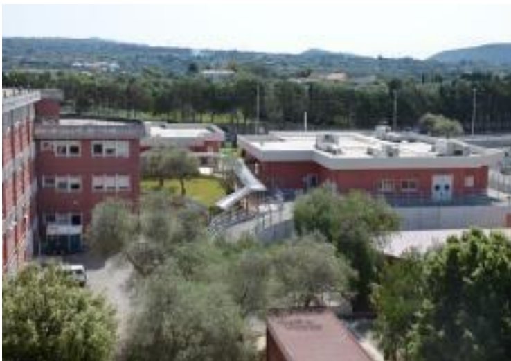
Figura 1 –ODVU